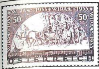
Sello de Austria para la «Wipa 33». A la derecha: Todas las manifestaciones filatélicas importantes están acompañadas por una producción abundante de material publicitario.

peciales que se venden sólo dentro de la muestra misma y, en general, por cada serie que se compra se obtiene un billete de entrada.